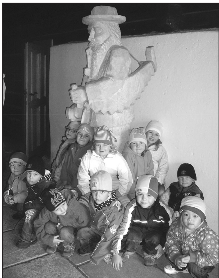
Děti z mateřské školy se s „volarským dřevorubcem“ spřátelily

Školní rok se rozběhl na plné obrátky, děti přišly po prázdninách odpočaté a plné elánu. Stejně jako paní učitelky, které se zase budou celý rok snažit, aby dětem bylo ve školce hezky, aby se jim zde líbilo a samozřejmě aby se zde něco naučily a něco poznaly.