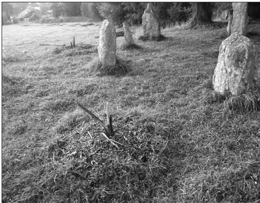
Opravdu se musí vše ničit?