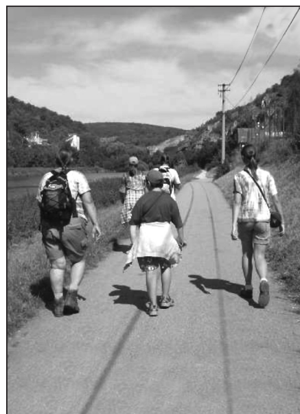
Skauti na cestě za poznáním...