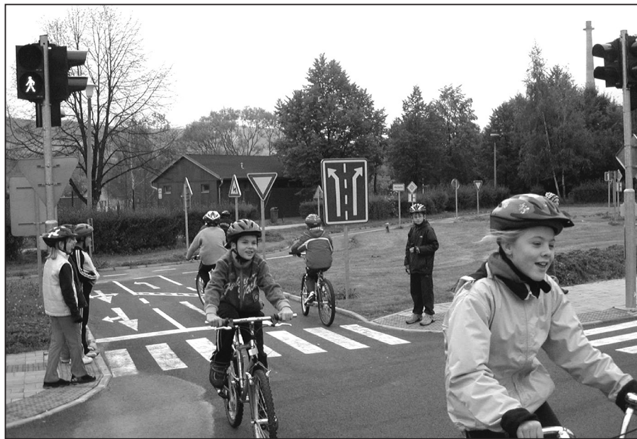
Děti se učí pravidlům silničního provozu