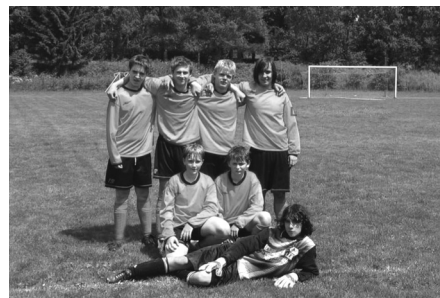
Žáci, kteří v loňském roce odešli z oddílu